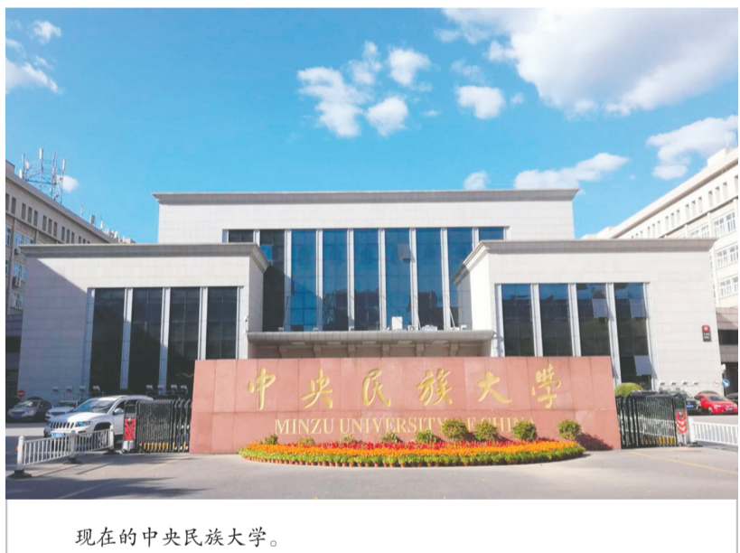
现在的中央民族大学。

邓小平同志于1978年至1985年先后3次接见中央民族学院干部训班学员。1980年8月26日,邓小平指出“中央民族学院和各地民族学院都要加强”。