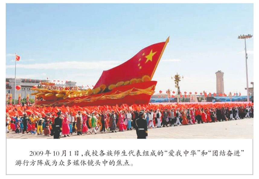
2009年10月1日,我校各族师生代表组成的“爱我中华”和“团结奋进”游行方阵成为众多媒体镜头中的焦点。

在中国特色社会主义新时代,我将不忘初心,牢记使命,铸牢中华民族共同体意识的育人阵地,为加快建设特色鲜明的世界一流大学,为实现“中华民族伟大复兴、同心共筑中国梦”的时代责任与重大使命,做出新的更大的贡献!