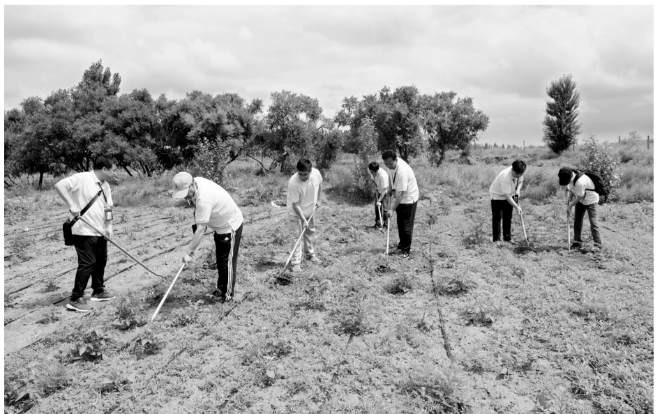
本版文字、摄影，除署名外，均为周陈。