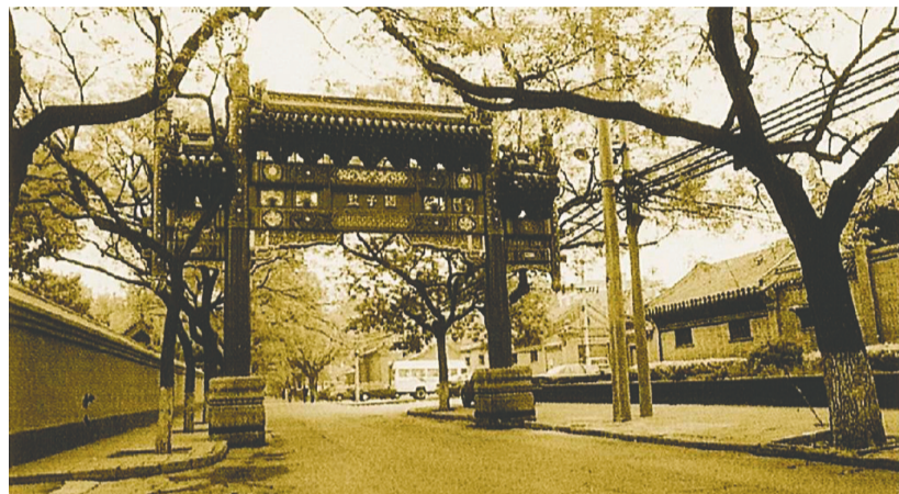
学院初建校址分设北京东城区国子监、东四七条胡同、分司厅、大格巷、拐棒胡同、雍和宫等处,以国子监为院部。