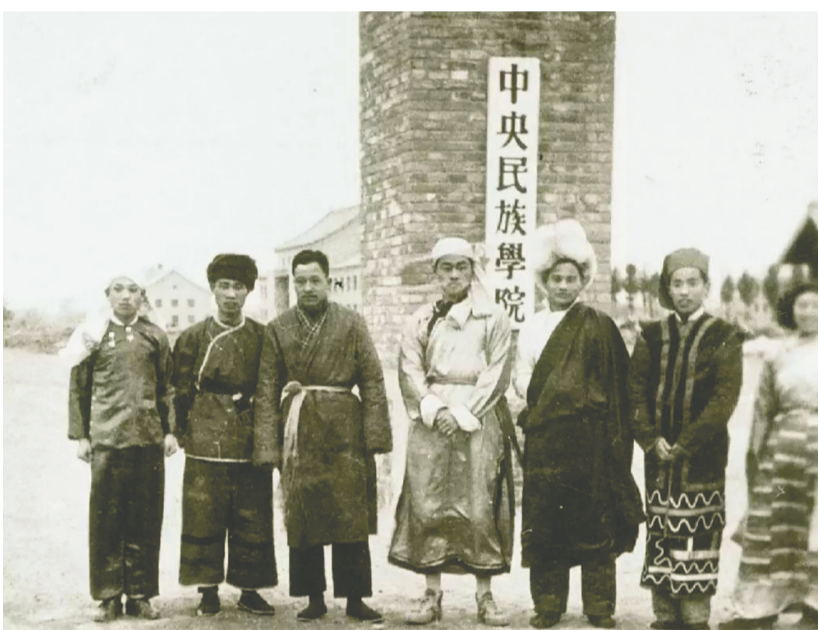
20世纪50年代白石桥校址(现海淀校区)。