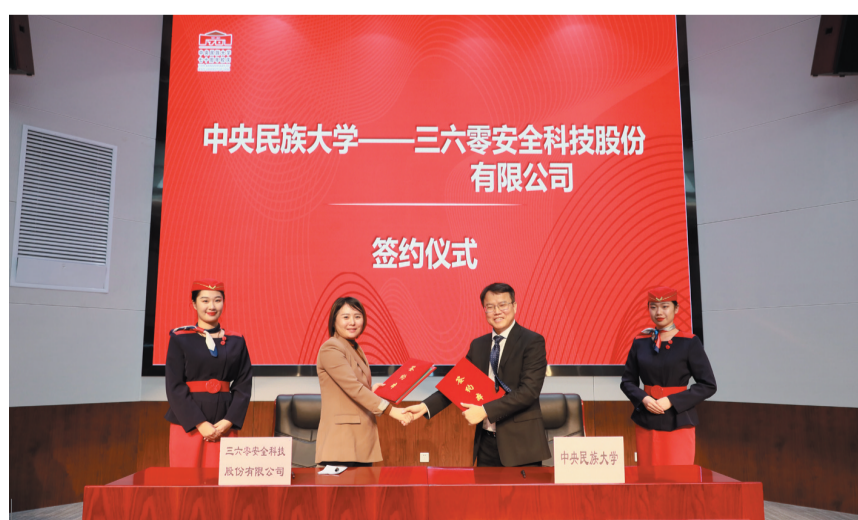
党委常委、副校长石亚洲与三六零安全科技股份有限公司总经理姜思红，代表双方签署《中央民族大学 三六零安全科技股份有限公司 战略合作框架协议》。