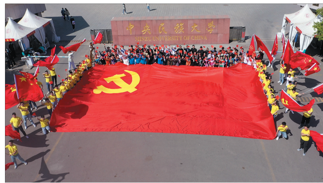
中央民族大学各族师生员工代表在校内外开展活动,献礼建党100周年。

作为中国共产党创办民族高等教育的成功典范,中央民族大学(1993年更名)将于10月16日迎来70周年校庆。缘起延安,辗转转川,1951年复办于北京,中央民族大学因党而生、为党而立、向党而兴。党史学习教育开展以来,中央民族大学围绕“我从延安来 永远跟党走”主题,深入学习领悟习近平新时代中国特色社会主义思想,努力把学习教育成果转化为“十四五”开好局、起好步的强大动力。