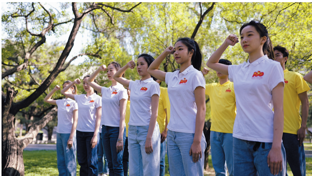
4月末,中央民族大学组织录制主题MV,各族师生员工代表深情唱起《唱支山歌给党听》《没有共产党就没有新中国》,用歌声唱出爱党爱国爱社会主义的深情,献礼建党100周年。

10月13日,在喜迎建校70周年之际,《光明日报》(2021年10月13日05版)专版刊发题为“党史养料涵育民族团结之花——中央民族大学在党史学习教育中凝聚发展动力”系列文章,专题报道我校党史学习教育工作成效及特色亮点。中央党史学习教育官网、中国共产党新闻网、人民网、新华网、央视网、光明网、中国新闻网、中工网、中国青年网等中央新闻网站进行转载。全文如下: