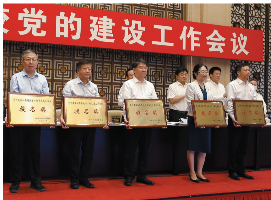
中央民族大学2021年荣获“北京市党的建设和思想政治工作先进普通高等学校”提名奖。

近年来，学校成立非物质文化遗产研究中心，入选文化和旅游部“中国非物质文化遗产传承人研修培训计划”，大力保护传承中华民族优秀传统文化；开设内蒙古乌兰牧骑音乐创作、舞蹈编导高级研修班，组织“争做乌兰牧骑文艺轻骑兵”主题活动，大力弘扬新时代乌兰牧骑精神，出版《22种民族古文字》《中国少数民族文字珍稀典籍汇编》等珍稀典籍，荣膺2017年度全国“优秀古籍图书奖”一等奖和第七届中华优秀出版物（图书）奖；推出《石榴花开》《红河谷（序）》《生命之光》《情深谊长》等大批既反映中华民族优秀传统文化的内涵与精华，又具有时代精神的优秀作品；负责北京地铁6号线西延段和7号线欢乐谷站、广渠门站内公共艺术作品