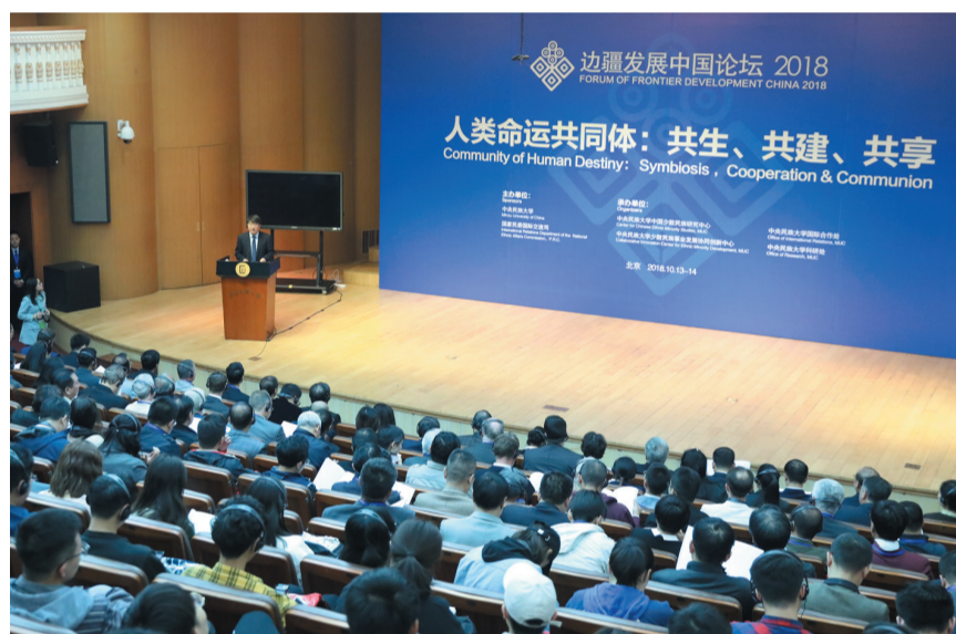
中央民族大学坚持服务于国家战略、服务于民族团结进步事业，首轮“双一流”建设成效显著。图为“边疆发展中国论坛2018”在校举办。