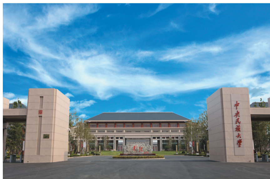
中央民族大学丰台校区南校门。

这是一所诞生于革命圣地延安的学校！这是一所成长于首都北京的学校！这是一所沐浴于党中央关怀的学校！这是一所肩负着党和国家特殊使命和光荣任务的学校！