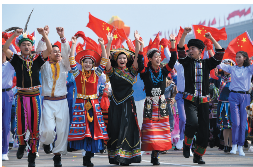
2019年10月1日，中央民族大学师生献礼新中国70周年华诞。

2019年，“中央民族学院设立”作为重要成就，入选“伟大历程 辉煌成就”新中国成立70周年大型成就展，也是唯一被单独展示的高校。