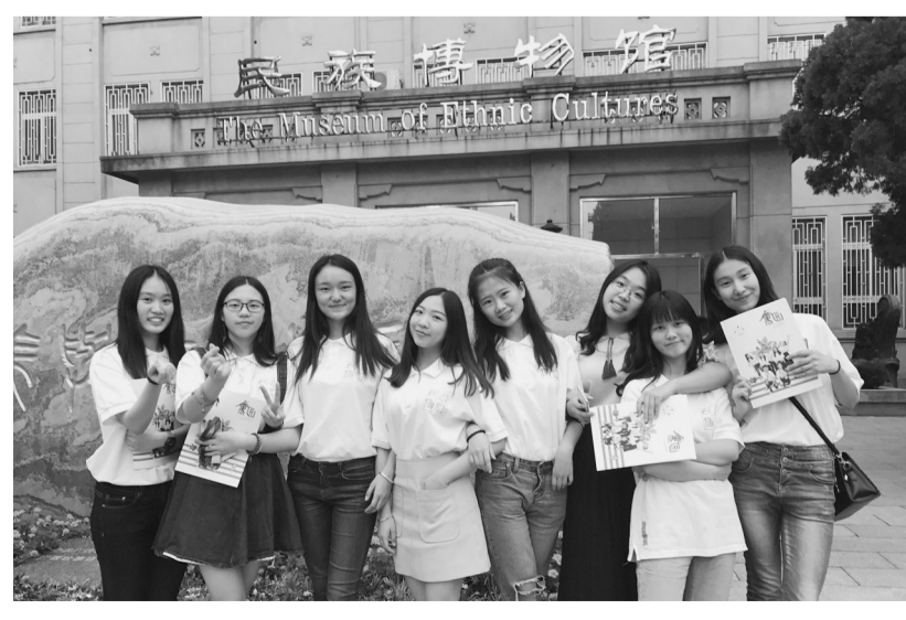
民族博物馆志愿者合影

院等高校学生,每年都会来博物馆进行教学参观和实习。 据介绍,民族博物馆的主要功能和职责是为学校的教学和科研服务。我校每年新生入学后,第一堂民族传统、民族文化教育课、文博、民族学、历史学、民族语言学、宗教学等专业学生的实践课都在这里进行。据统计,近两年来,民族博物馆接待的校内外教学参观累计达数万人次。 这么多的参观者,都是由谁来接待的呢? 那就是——民族博物馆志愿者中心的志愿者们! 志愿者中心成立于2004年,主要招募和培训学校本科生成为志愿讲解员,宣传少数民族优秀文化,参与