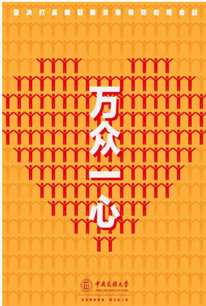
《万众一心》(美术学院 石硕)

作品以雨伞形象象征为大众遮风避雨，奋战在抗击疫情最前线的广大医务人员，是(她)们用坚定的意志、无畏的奉献为我们撑起一片蓝天。