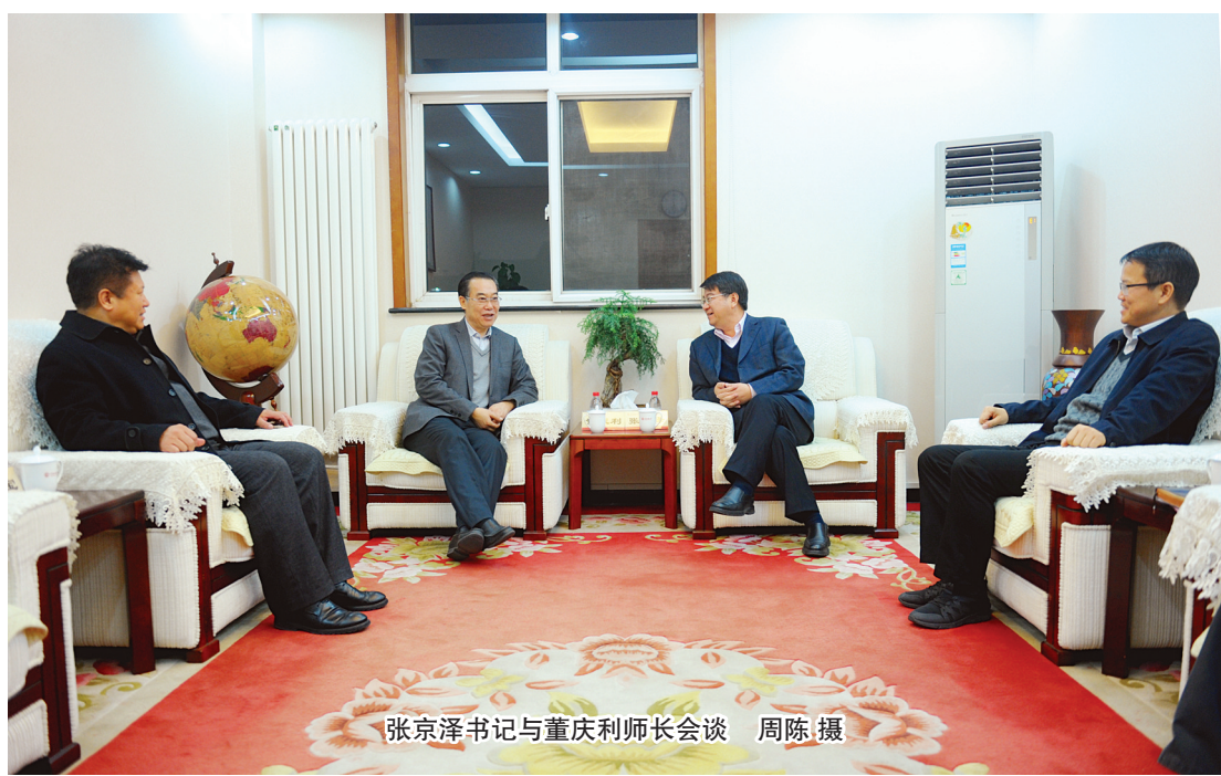
张京泽书记与董庆利师长会谈

本报讯(记者 周陈)2017年12月29日下午，新疆生产建设兵团第十二师师长董庆利一行来校调研，就人才培养、科研合作以及基础教育支援等与我校进行了交流。